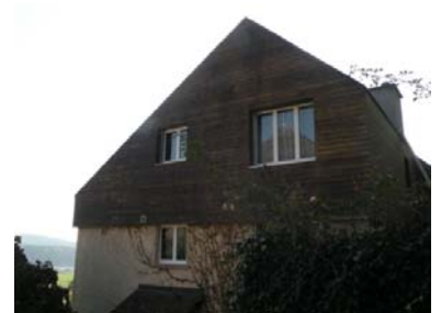
Fassaden vor Sanierung, verschiedene Ansichten der verwitterten Holzschalung